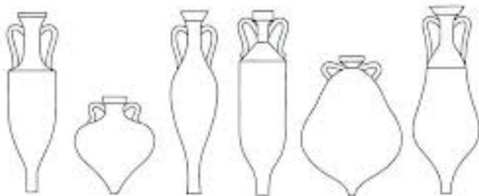
Amphorae (Storage Jars)

We hebben een schat in aarden vaten. Als alles vervalt, dan breekt ook het vat. Maar we willen voor Hem ons leven hier laten 't gaat Hem alleen om de schat. 2x